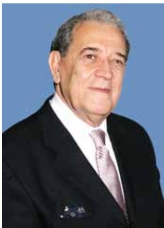
Adm. Wallace Vieira