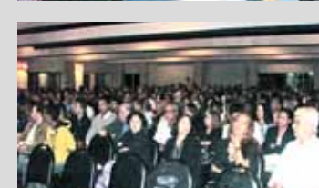
O I ENCAD em Niterói levou mais de 600 pessoas ao Clube Tio Sam Barreto