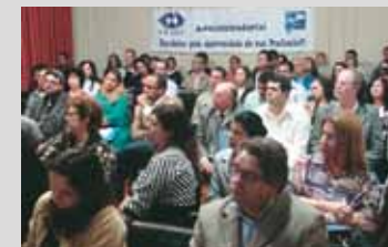
Na região de Campos dos Goytacazes o I ENCAD foi realizado no Palace Hotel