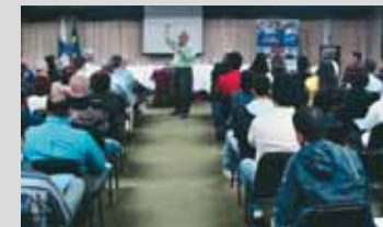
Em Cabo Frio, o I ENCAD da Região dos Lagos, foi realizado no salão de convenções do Hotel Caribe

Representante Casa do Administrador Região Grande Niterói