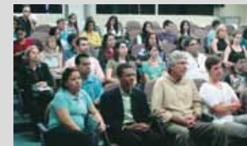
Em Nova Friburgo foram ministradas três palestras no I ENCAD da Região Serrana III