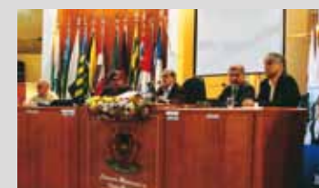
I ENCAD de Volta Redonda foi realizado na Câmara Municipal