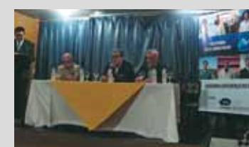
Em Petrópolis, o I ENCAD da Região Serrana I foi realizado no Casa do Sol Hotel