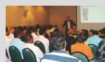
O evento em Macaé abordou o tema Mercado de trabalho